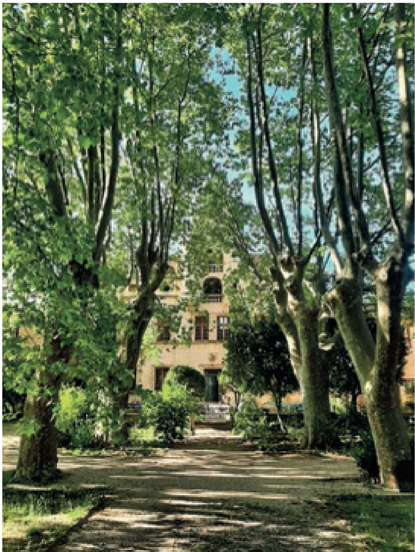
Eloge de l'arbre 2 Château Le Plaisir Aramon